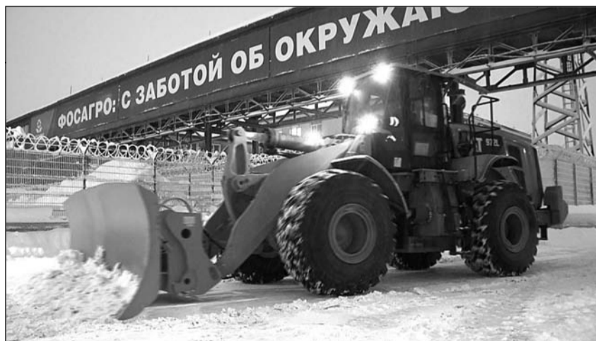
Новый погрузчик обкатывали на территории «ПромТрансПорта»

Импортный погрузчик не единственный новичок, который специалисты «ПромТрансПорта» принимали в канун Нового года. Экс-