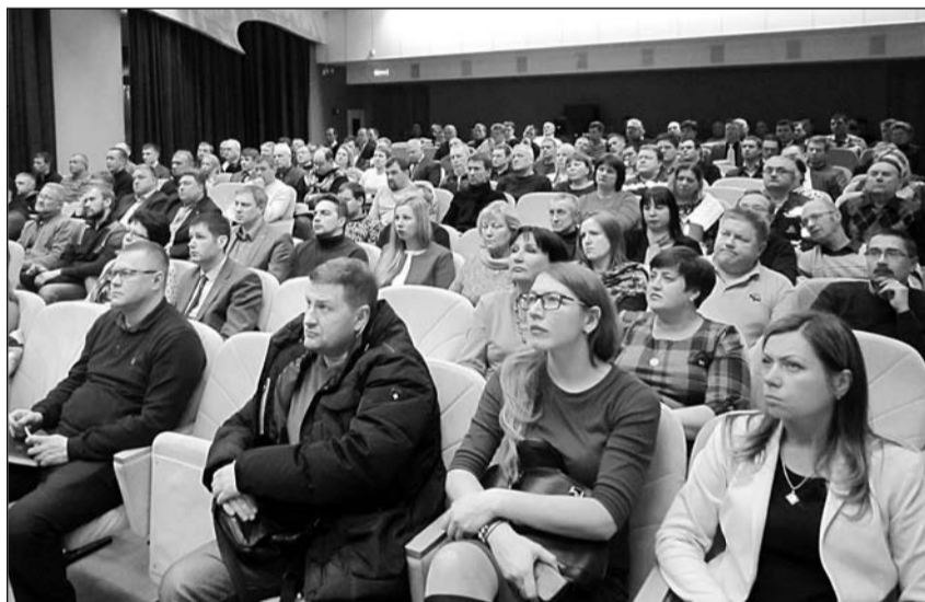
В совещании участвовали представители подрядных и дочерних организаций, цехов «Апатита»

– У нас разработана программа по подрядным организациям на 2018 год, включающая перечень