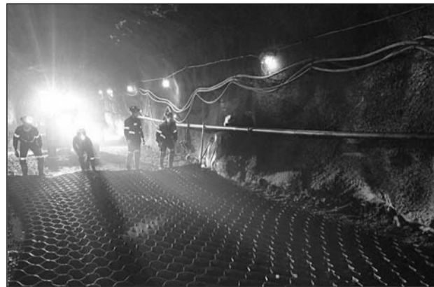
Работники дорожного участка растягивают георешётку